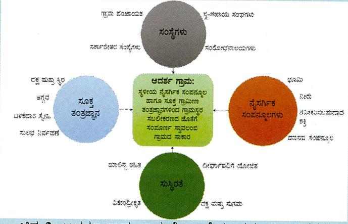
ಚಿತ್ರ 2: ಆದರ್ಶ ಗ್ರಾಮ ಕಾರ್ಯಯೋಜನೆಯ ಪ್ರಮುಖ ಅಂಗಗಳು

ಆದರ್ಶ ಗ್ರಾಮದ ಯೋಜನೆಗಳನ್ನು ಕಾರ್ಯಗತಗೊಳಿಸಲು ಸ್ಥಳೀಯ ಸಂಘ-ಸಂಸ್ಥೆಗಳ ಸಹಕಾರ ಅತಿ ಮುಖ್ಯ. ಗ್ರಾಮ ಪಂಚಾಯಿಯು ಅಭಿವೃದ್ಧಿ ಯೋಜನೆಗಳನ್ನು ಜಾರಿಗೊಳಿಸುವಲ್ಲಿ ಮತ್ತು ಫಲಾನುಭವಿಗಳಿಂದ ಪ್ರತಿಕ್ರಿಯೆ ಪಡೆಯುವಲ್ಲಿ ಪ್ರಮುಖ ಪಾತ್ರ ವಹಿಸುತ್ತದೆ. ಇದು ಇತರ ಸ್ವ ಸಹಾಯ ಗುಂಪುಗಳೊಂದಿಗೆ, ಗ್ರಾಮ ಅರಣ್ಯ ಸಮಿತಿಯೊಂದಿಗೆ ಹಾಗೂ ಸರ್ಕಾರೇತರ ಸಂಘ-ಸಂಸ್ಥೆಗಳ ಸಹಭಾಗಿತ್ವದಲ್ಲಿ ಯೋಜನೆಗಳನ್ನು ಅನುಷ್ಠಾನಗೊಳಿಸುವ ಸ್ವಾತಂತ್ರ್ಯವನ್ನು ಹೊಂದಿದೆ. ಸರ್ಕಾರಿ ಹಾಗೂ ಖಾಸಗಿ ಸಂಶೋಧನಾ ಸಂಸ್ಥೆಗಳು ಸಹ ಕೌಶಲ್ಯ ವರ್ಧಕ ತರಬೇತಿಗಳಿಂದ, ನೂತನ ತಾಂತ್ರಿಕತೆಯನ್ನು ಪರಿಚಯಿಸುವುದರ ಮೂಲಕ ಗ್ರಾಮೀಣ ಪರಿಸರದ ಪ್ರಗತಿಗೆ ಕೊಡುಗೆ ನೀಡಬಹುದು.